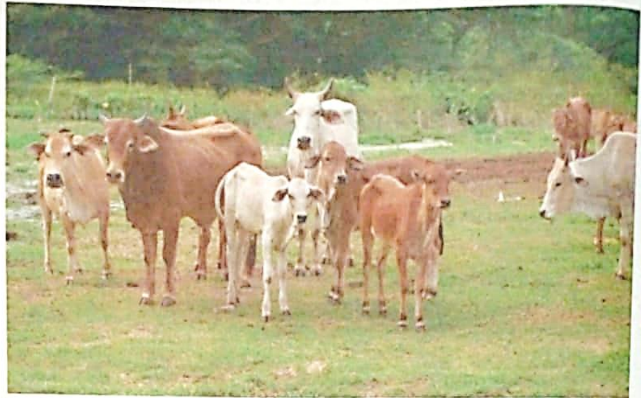
Harga lembu yang meningkat tidak menghalang umat Islam di negara ini untuk melaksanakan ibadah korban. - Gambar hiasan

"Apabila temakan korban disembelih oleh orang ramai dan mereka 'meniatkan' sebagai wakil atas nama peribadi si pemberi kerana temakan itu telah menjadi haknya, maka barulah boleh dianggap