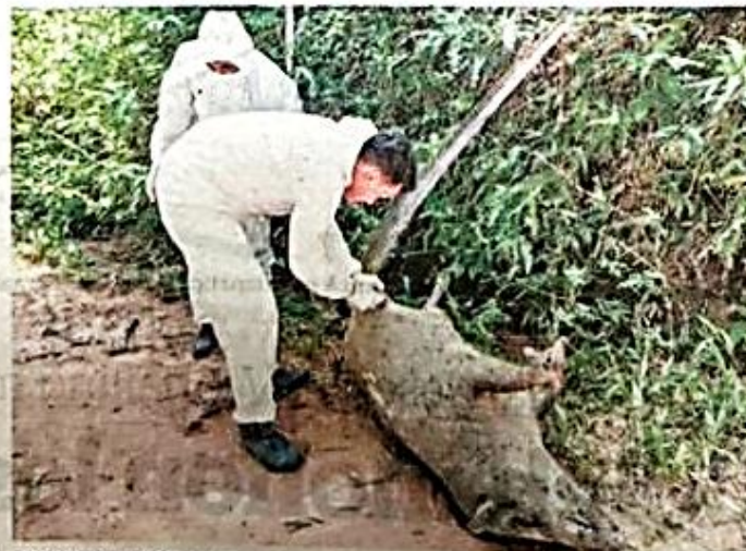
PEGAWAI JPV Terengganu memeriksa bangkai babi hutan yang disyaki mati akibat penyakit ASF di Hutan Air Putih, Kemaman baru-baru ini.

Dalam perkembangan sama, tambah beliau, pihak JPV Terengganu turut melakukan pemantauan di kesemua daerah di negeri ini sebagai langkah awal pencegahan penularan tersebut.