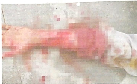
Tangan kiri mangsa yang cedera parah akibat diserang babi hutan di Taman Desa Wangi, Kampung Kubang Siput, Kota Bharu pada Rabu.