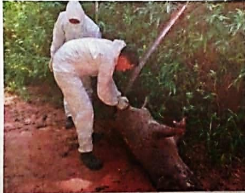
Sampel babi liar yang mati di kawasan hutan Air Putih, Kemaman diambil bagi mengenal pasti punca kematian.

"Pihak veterinar telah mengambil sampel pada bangkai haiwan berkenaan pada 21 dan 22 Jun lalu dan keputusan ujian sampel yang diketahui pada 27