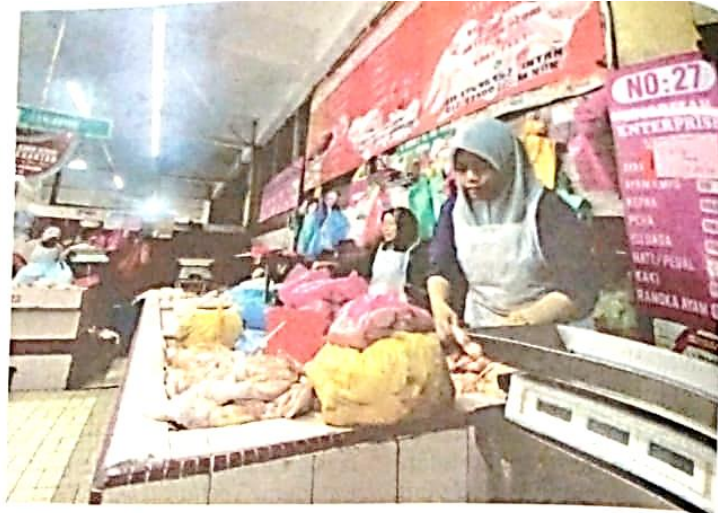
PENIAGA nafi mereka menyimpan bekalan ayam sebelum ini untuk memanipulasi harga